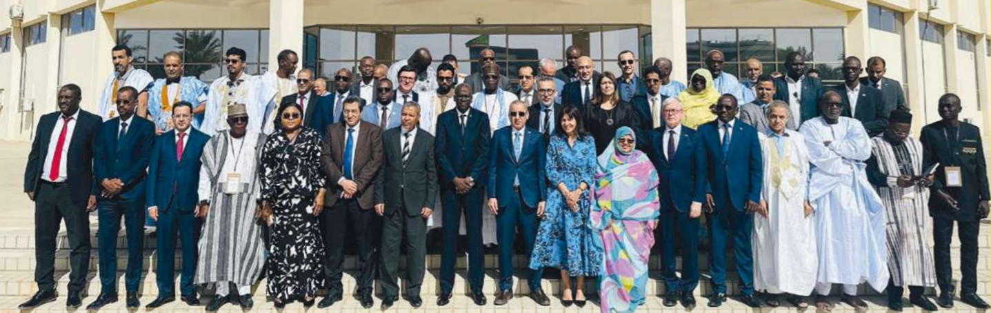
Conférence internationale « Soutenir les collectivités engagées pour la paix, la sécurité et le développement au Sahel », Nouakchott - janvier 2025