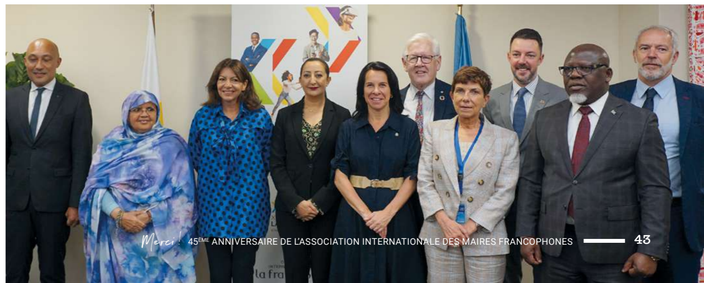
2024 - Rencontre entre les Maires de Montréal, Nouakchott, Paris et Rabat, le Groupe des Ambassadeurs Francophones et la Représentation de l'OIF auprès des Nations Unies.

De même, la Commission sur le financement durable des villes, placée sous les auspices des Nations Unies et co-présidée par Jeffrey Sachs, envoyé spécial auprès du Secrétaire général de l'ONU et la Maire de Paris, présidente de l'AIMF, Anne Hidalgo, propose des solutions innovantes pour le financement des collectivités territoriales en lien avec la transition écologique et le développement durable.