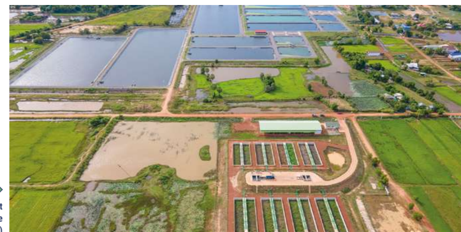
Station de traitement et de valorisation des boues de vidange de Siem Reap (Cambodge)

> 9 partenaires techniques et financiers, engagés aux côtés des collectivités bénéficiaires et de l'AIMF : SIAAP, Agence de l'eau Seine Normandie, Agence de l'eau Rhin Meuse, Metz Métropole, Département des Hauts de Seine, Ville de Lausanne, Nantes métropole, Fondation Gates, AFD