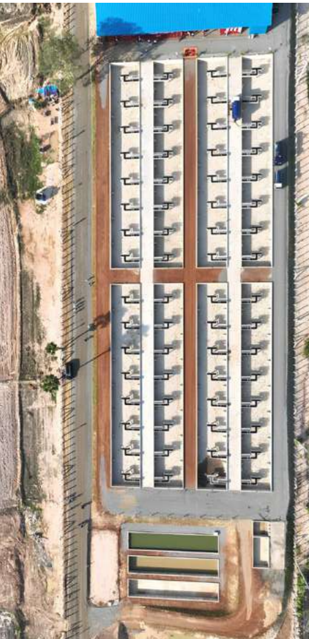
2022 - Construction de la station de traitement des boues de vidange de Phnom Penh