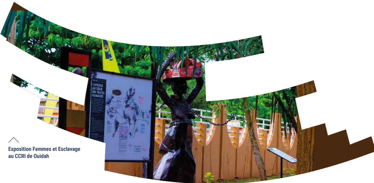
Exposition Femmes et Esclavage au CCRI de Ouidah

En écho à cette démarche, un travail a été engagé par la municipalité de Cap Haïtien, en partenariat avec la Nouvelle Orléans, en lien avec leur comité de coopération décentralisée « Villes sœurs réunies », et avec l'appui de l'AIMF. Cette coopération a abouti à la préfiguration du Centre Mémoriel et Polyvalent du Cap-Haïtien, espace vivant pour la mémoire de l'esclavage. Un nouveau défi pour l'AIMF : aider le consortium à trouver les financements complémentaires pour la réalisation du Centre.