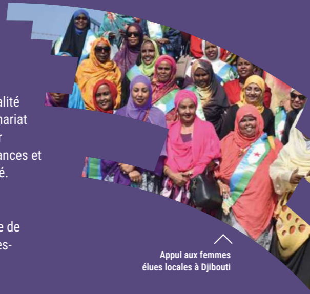
Appui aux femmes élues locales à Djibouti

L'AIMF produit le CLOM « L'égalité Femmes-Hommes, une ambition commune », pour soutenir les collectivités locales dans la mise en œuvre d'une gouvernance locale sensible au genre.