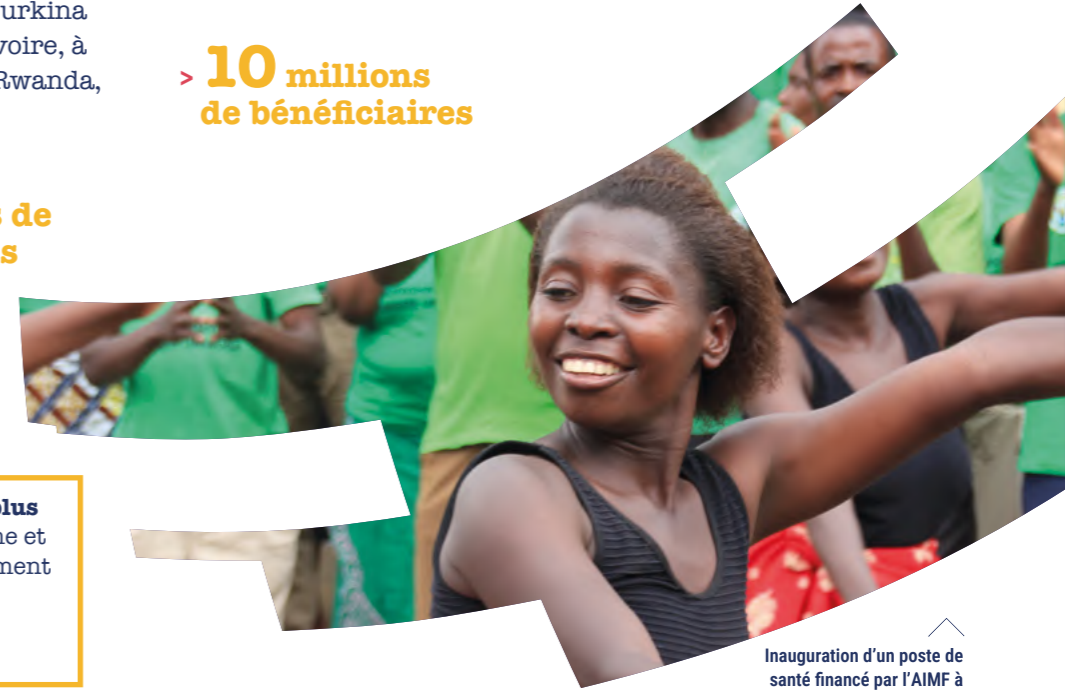
Inauguration d'un poste de santé financé par l'AIMF à Rubavu (Rwanda) - 2019