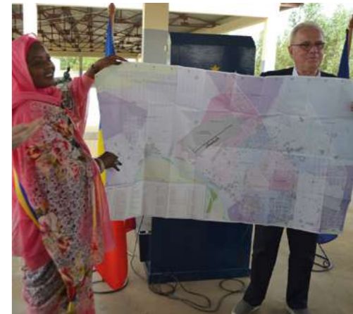
Plan et adressage de Njaména - 2018

> 1 solution déployée auprès de collectivités locales dans 18 pays : Bénin, Burkina Faso, Burundi, Cameroun, Centrafrique, Comores, Congo, Gabon, Guinée, Madagascar, Mali, Maroc, Niger, RDC, Sénégal, Tchad, Togo, Tunisie