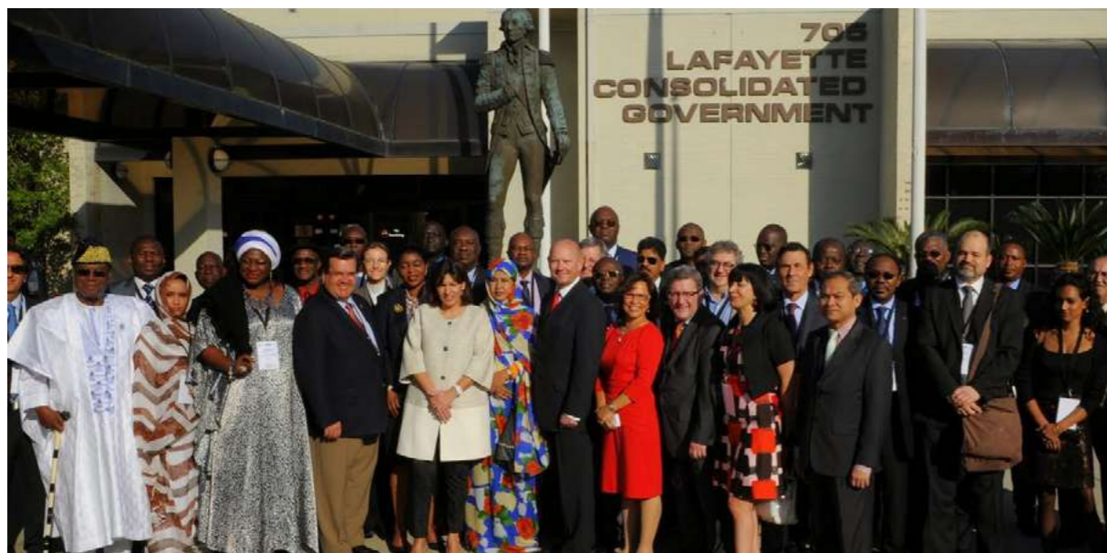
Lafayette & Nouvelle Orléans 2015 Territoire, mémoire collective et développement local

L'AIMF s'est aussi toujours attachée à valoriser la diversité des points de vue, notre plus grande richesse pour élargir notre compréhension du monde. Et dans une époque de plus en plus complexe et polarisée, l'AIMF reste aujourd'hui un espace qui rassemble au-delà des différences.