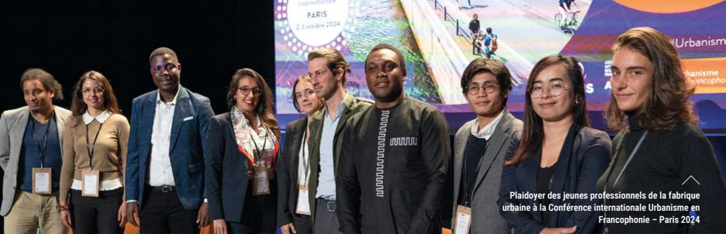
Plaidoyer des jeunes professionnels de la fabrique urbaine à la Conférence internationale Urbanisme en Francophonie - Paris 2024