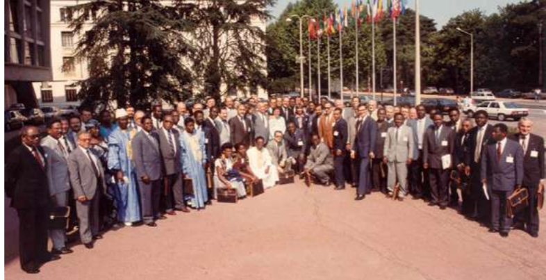
Lyon 1988 - 8ème Assemblée générale - Jeunesse et sports

Dès sa création, l'AIMF a été pour les Maires et leurs équipes un espace où partager les défis auxquels ils font face et les solutions qu'ils déploient localement.