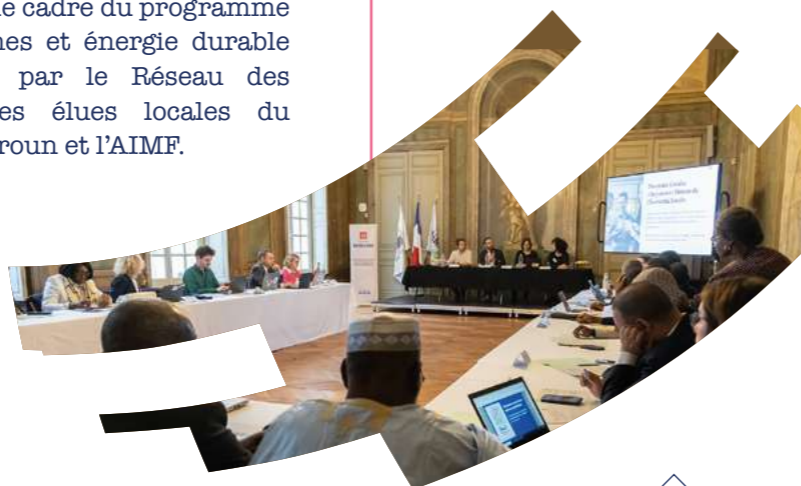
Bordeaux, 2021 : 1 ère réunion de la Commission « Villes en transitions économiques »

Créée en 2021, la Commission « Villes en transitions économiques » animée par Bordeaux nourrit les échanges de bonnes pratiques et la construction d'une vision commune sur ces questions.