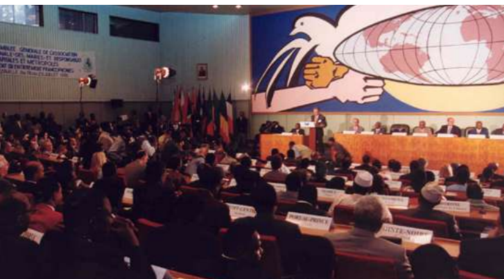
Brazzaville 1996 - 16ème Assemblée générale L'organisation des services municipaux

Les thématiques de travail ont bien sûr évolué, en même temps que changeaient le statut, le périmètre d'intervention et le leadership politique des autorités locales. Du colloque sur « La gestion de l'information » à Québec en 1987 aux échanges sur l'Intelligence Artificielle en 2024, de la première rencontre sur « L'environnement urbain » à Niamey en 1992 à l'organisation de la première COP des villes en 2022 : l'AIMF accompagne depuis 45 ans les mutations du monde local et de la solidarité internationale entre les villes.