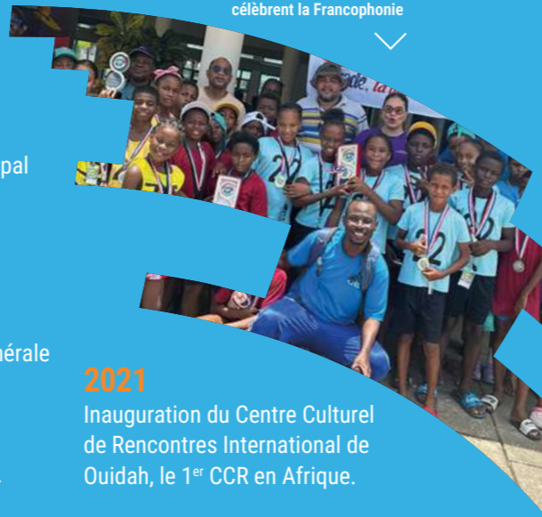
Les jeunes de Victoria célèbrent la Francophonie

Notre avenir repose sur notre capacité à donner à notre jeunesse – à toute notre jeunesse – la possibilité de s'éduquer et de se cultiver. Et cela se joue, bien sûr, dans la proximité, au niveau local, là où nous, Maires, avons un rôle essentiel à jouer dans la mise en place de politiques culturelles et éducatives adaptées aux besoins de nos communautés. À Victoria, nous avons toujours accordé une place centrale à l'éducation et à la culture. Chaque année, pour la Journée de la Francophonie, nous mettons en œuvre en partenariat avec la Commission Nationale de la Francophonie des initiatives concrètes. Victoria, seule ville des Seychelles, ne cesse de s'impliquer davantage pour permettre à nos jeunes de participer dans la vie culturelle, sociale, économique et artistique. Notre objectif principal : leur offrir des opportunités d'apprentissage, d'échange et de création, afin qu'ils puissent s'épanouir et contribuer activement à la société. L'AIMF a toujours été un de nos partenaires clé dans ces actions en soutenant directement ou indirectement nos initiatives. Pour ce 45 e anniversaire, je formule le vœu que nous puissions continuer à renforcer cette collaboration, à innover ensemble et à offrir aux jeunes les moyens de bâtir un monde plus juste, plus inclusif et plus éclairé. ”