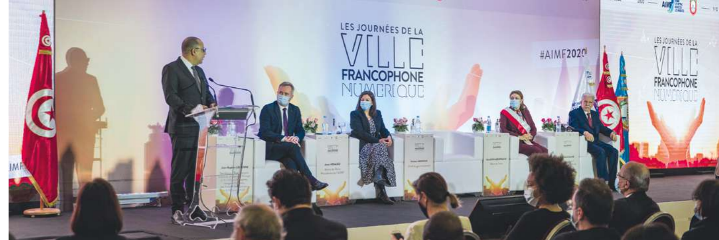
Tunis – Congrès 2020 de l'AIMF « La ville francophone numérique »