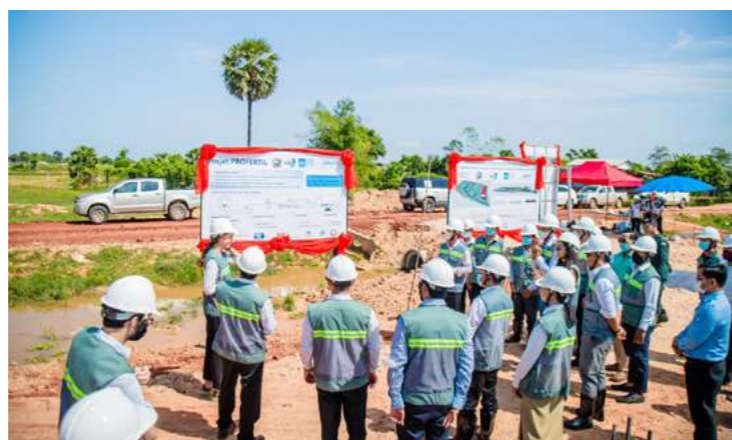
Siem Reap 2020 Visite du programme Profertil