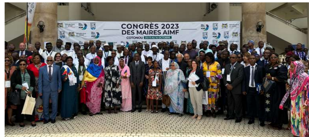
Cotonou 2023 43ème Congrès de l'AIMF

à tous les Maires, Mairesse, Bourgmestres, Syndics, Gouverneur.e.s, élu.e.s et dirigeant.e.s des autorités locales qui, à travers le temps et par leur engagement, ont bâti la belle famille de l'AIMF.