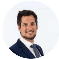
Adrien Dolimont Ministre-Président de la Wallonie