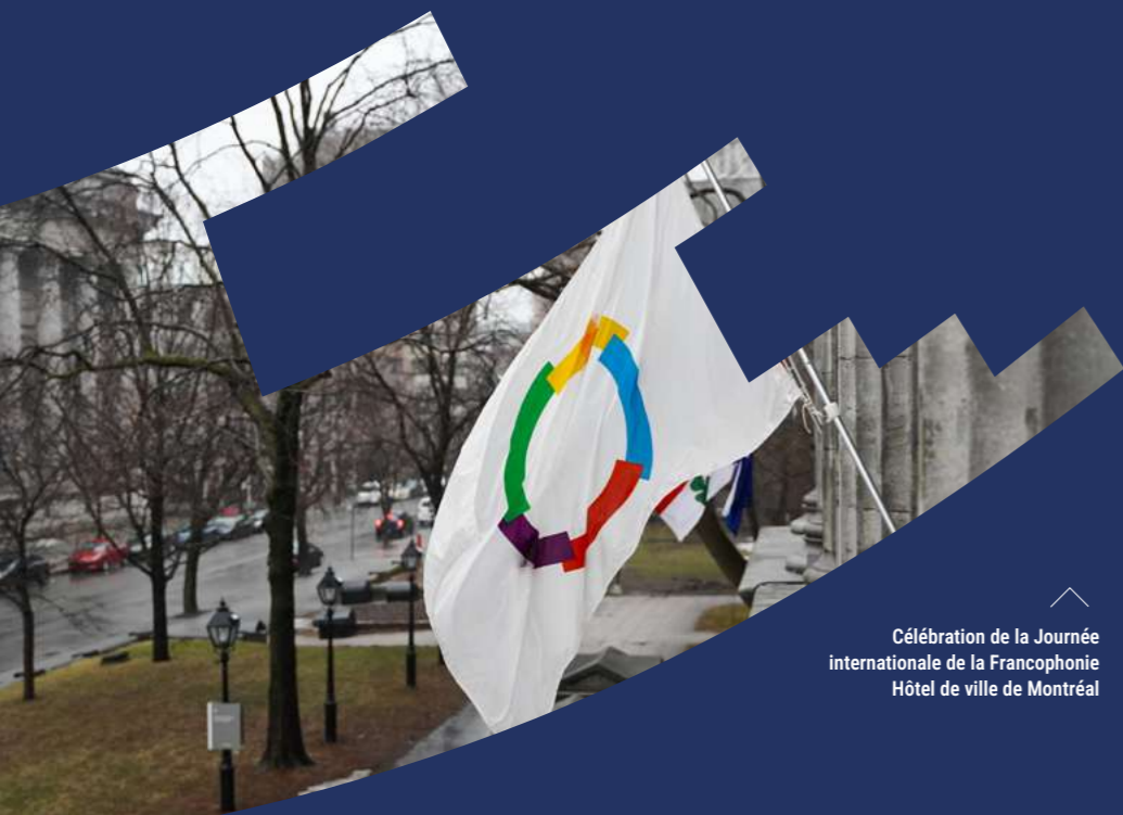
Célébration de la Journée internationale de la Francophonie Hôtel de ville de Montréal

Mais bien plus que cela, ce nouveau statut marquait aussi la reconnaissance du rôle essentiel qu'ont à jouer les Maires pour faire vivre, dans leurs villes et à travers leurs coopération internationale, les valeurs francophones qui nous rassemblent : la diversité culturelle, la fraternité, la solidarité, l'Etat de droit, le développement durable.