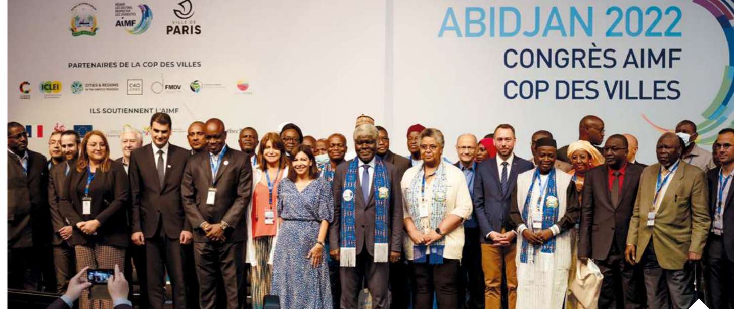
1 ère COP des Villes Abidjan, juillet 2022