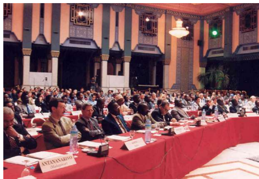
Marrakech 1997 - Colloque «Le logement et la ville»