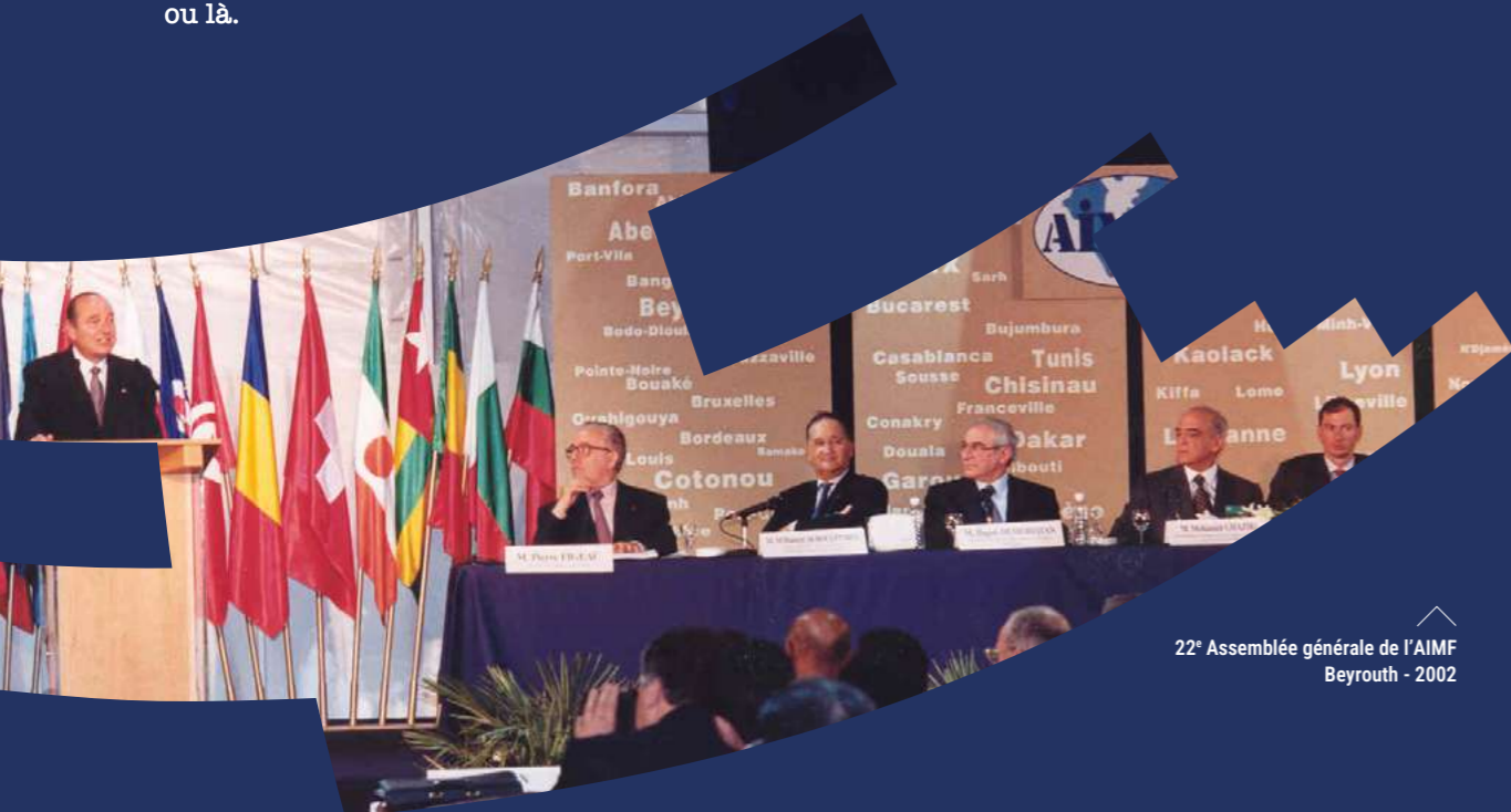
22 e Assemblée générale de l'AIMF Beyrouth - 2002

Et le 1 er mai 1979, à l'invitation de Jean Pelletier, à Québec, est lancée l'AIMF. Elle rassemble alors une vingtaine de Maires, liés d'amitié et d'une même volonté : coopérer pour résoudre les problèmes quotidiens de leurs villes, et donner une expression concrète à leur solidarité. Le Maire de Paris, Jacques Chirac, en est le premier Président.