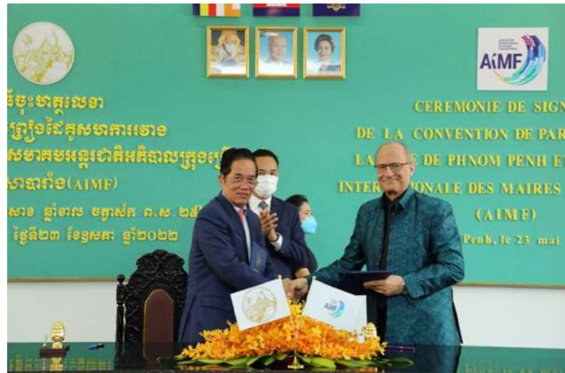
2018 - Convention globale de partenariat entre Phnom Penh et l'AIMF

“ C’est un grand plaisir pour moi de célébrer le 45ème anniversaire de notre chère Association Internationale des Maires Francophones. Dès notre adhésion en 1990, notre coopération s’est inscrite dans le long terme et a été marquée par des projets structurants et innovants ainsi que l’amélioration de l’environnement, de l’assainissement, de l’héritage culturel, de préparation aux situations d’urgence et de transition numérique.