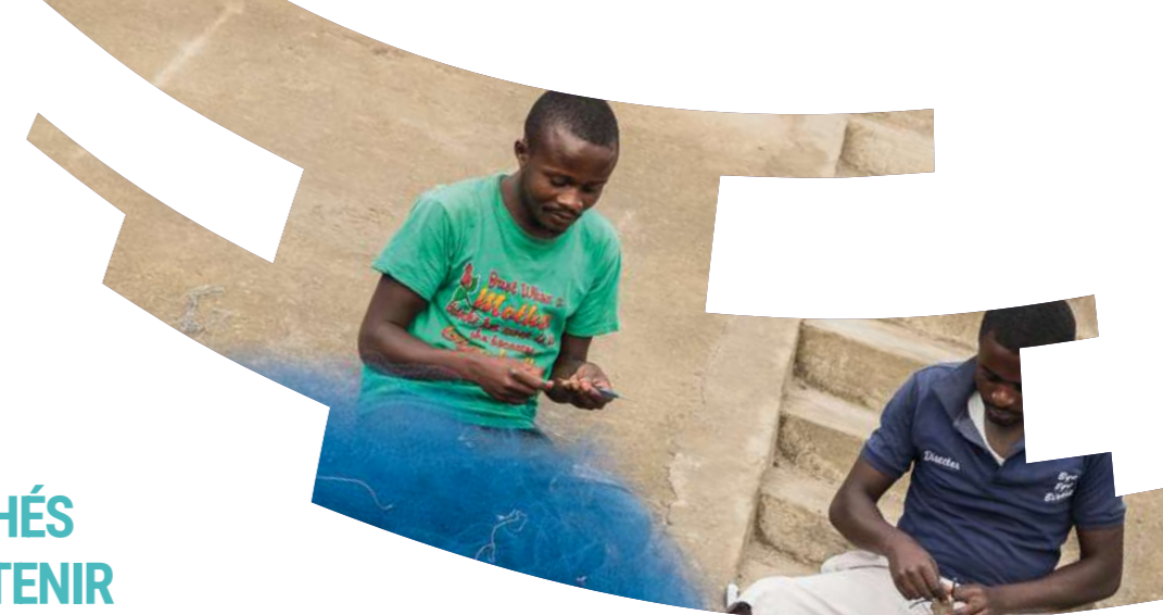
Construction de la pêche moderne de Kituku, à Goma (RDC) - 2016

L'appui à la construction de marchés a toujours été une demande des Maires au Fonds de coopération : de la construction du marché couvert de Balbala à Djibouti en 1991 à la construction du marché de Kabasazi à Gitega en 2018 en passant par la construction du marché Thuan Loc de Hué en 2007 ou celle du marché à bétail de Tahoua en 2006.