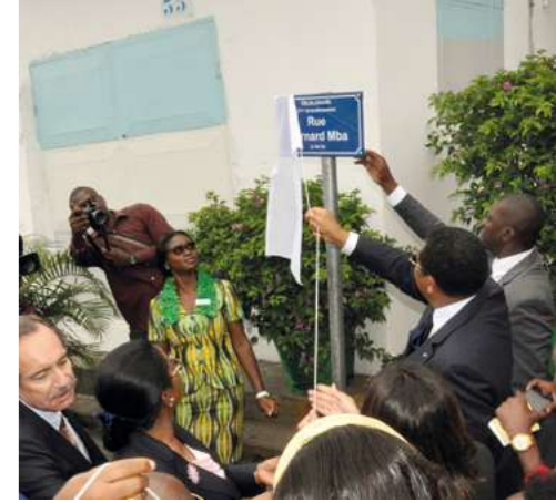
Pose de plaques de rues à Libreville

En témoignage de cette parfaite collaboration, les sources de SIM_ba ont été transférées au MINADT en 2017. Le déploiement et la maintenance du logiciel sont désormais assurés par une start-up camerounaise.