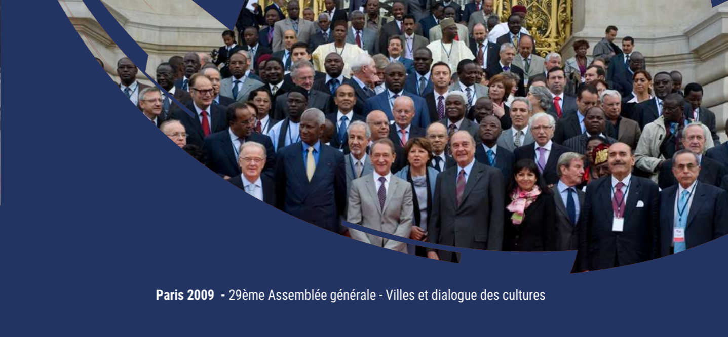
Paris 2009 - 29ème Assemblée générale - Villes et dialogue des cultures