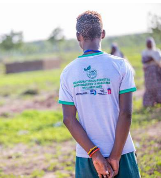
← Ceinture verte de Ouagadougou Inauguration - 2024

L'impact des projets appuyés, mais aussi les procédures spécifiques mises en place, qui offrent une adaptation aux réalités des collectivités, tout en donnant des garanties de gestion opérationnelle et financière aux plus hauts standards, ont permis de construire un lien de confiance durable avec nos partenaires. À la clé : un Fonds de coopération toujours plus fort, au bénéfice des villes membres et de leurs habitant.e.s !