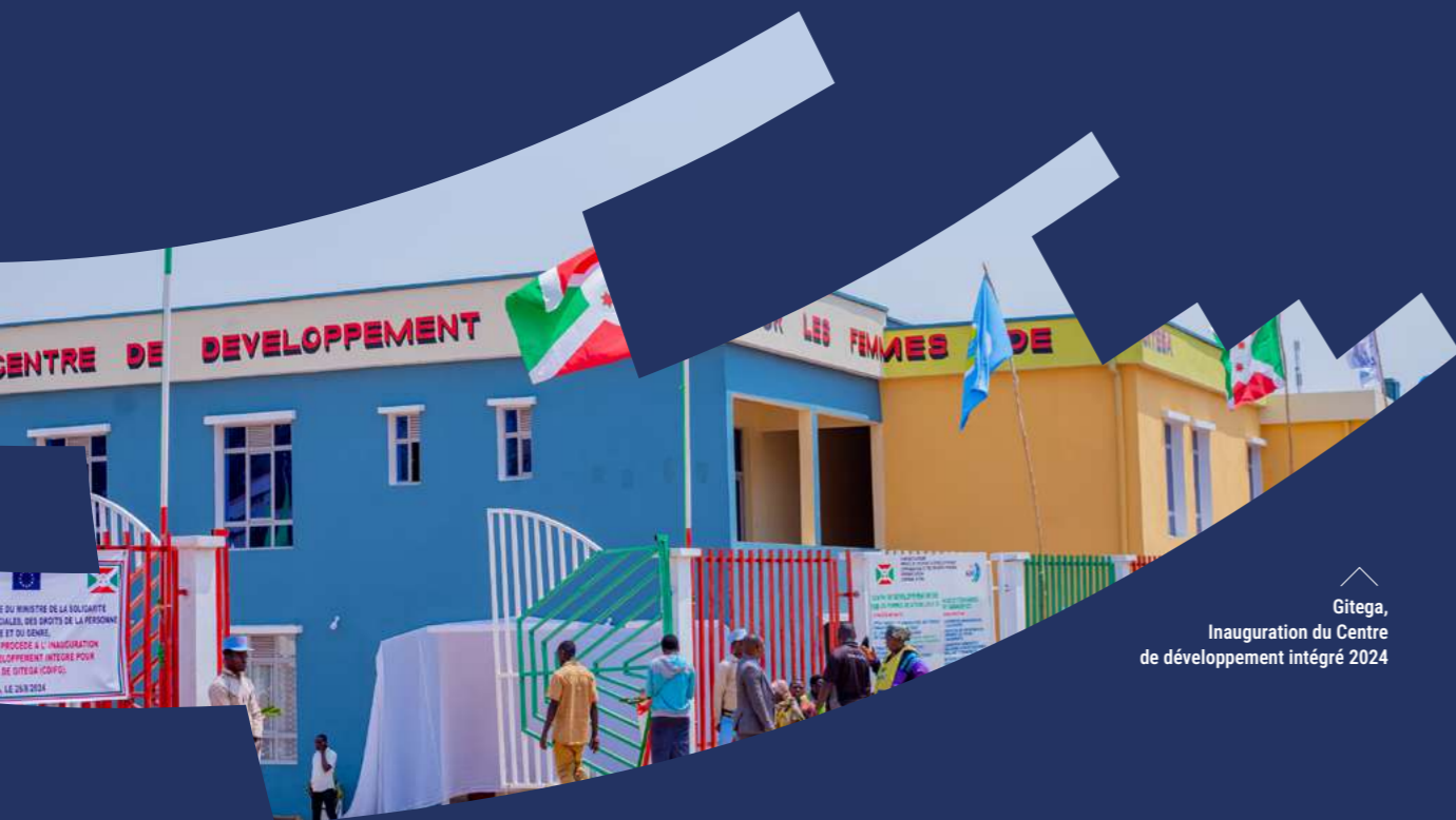
Gitega, Inauguration du Centre de développement intégré 2024

Au fil des ans, le Fonds de coopération s'est affirmé comme un outil particulièrement efficace pour localiser les ODD et de promouvoir l'innovation territoriale, prouvant ainsi son utilité pour les villes. Il intéresse aujourd'hui de plus en plus de partenaires publics ou privés qui souhaitent soutenir les autorités locales et avoir un impact de terrain.