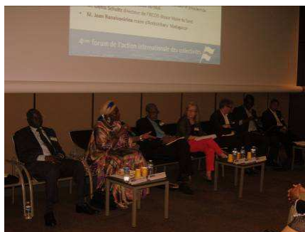
Madame le maire au Forum de la Coopération Paris - Juillet 2013

A Paris, ensuite le 1 er juillet pour la 4 ème édition du Forum de la Coopération Internationale des Collectivités organisé par CUF au palais des Congrès. Aux côtés de maires malien, malgache, mauritanien, Mme le Maire a témoigné lors de la table ronde « Coopération décentralisée et assainissement ; une compétence collective à partager », animée par le Programme Solidarité Eau (pS-Eau), de l'apport de la coopération décentralisée pour la création ou le renforcement d'un service d'assainissement ainsi que les clés pour la réussite du partenariat.