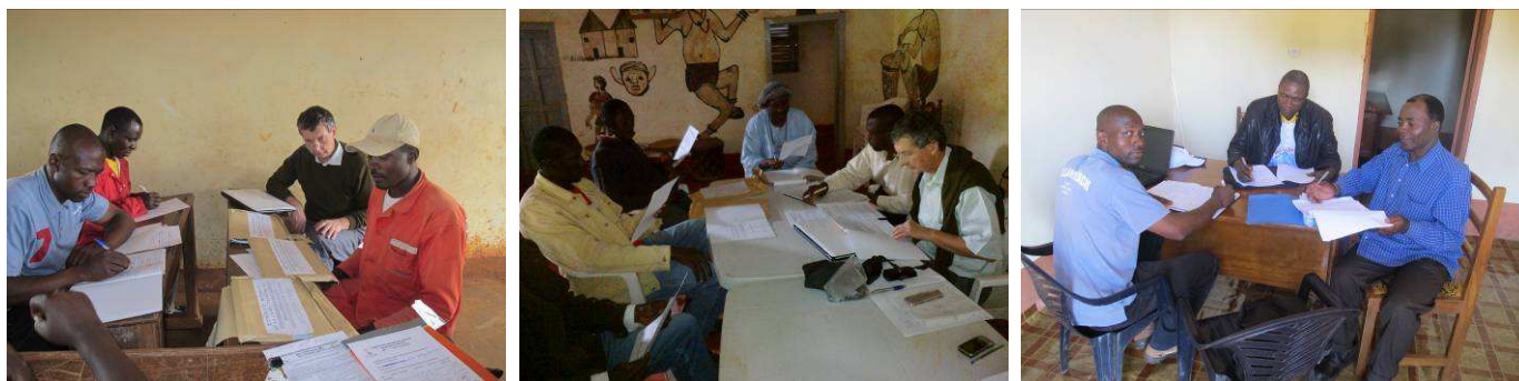
De gauche à droite : ouverture des plis à Bahouoc ; à Bangoulap ; session de travail entre la Régie communale, l'exploitant et le président du CUE de Baména.

Il est important de souligner que cette phase de contractualisation entre parties prenantes du service est un élément très nouveau pour tous et très apprécié par tous et répond particulièrement à l'objectif fixé dans Modeab de renforcer les capacités d'une maîtrise d'ouvrage durable de la commune.