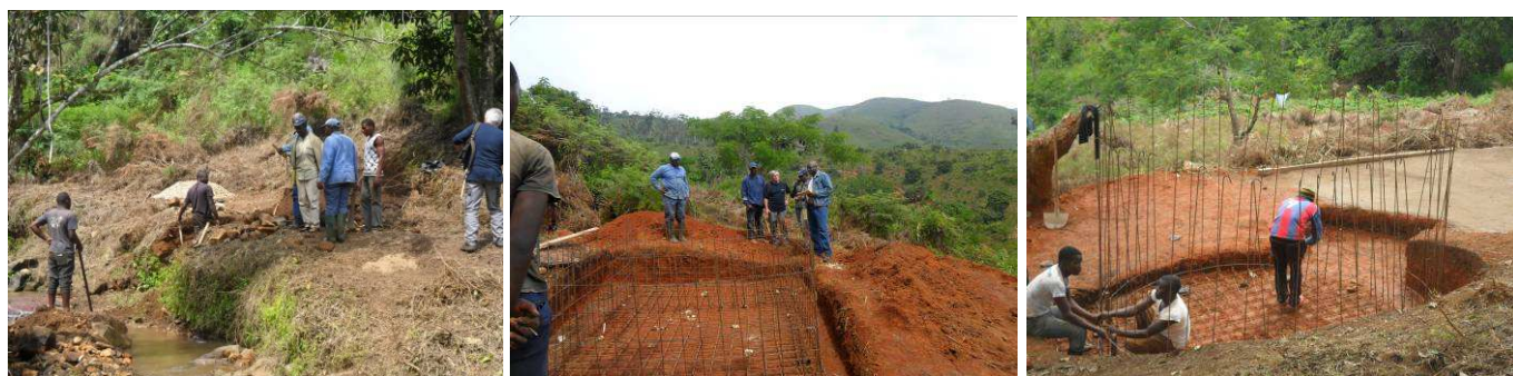
De gauche à droite : fouille ouvrage captage ; ferrailage décanteur ; ferrailage du réservoir en date de début juillet.

Actuellement l'entreprise réalise des travaux sur la partie production, à savoir : fouilles et pose des conduites de diamètre 63mm sur 170m de la partie refoulement, ouvrage du captage de 5m 3 , décanteur de 9m 3 et réservoir de 15m 3 . Sur la partie distribution, une équipe travaille à la réhabilitation de 6 bornes fontaines et la construction d'un mur d'enceinte en béton autour du château SW. Malgré la saison des pluies et la difficulté d'accès, l'entreprise suit un rythme de travail plutôt satisfaisant et la réalisation effectuée est estimée à 70%.