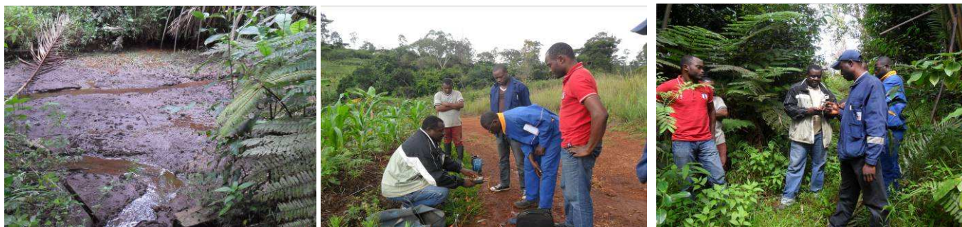
De gauche à droite : tarissement du captage SW en juin dernier ; entreprise WS en train de réaliser l'étude hydrogéologique.

L'entreprise Water Survey a fait une descente sur le terrain le 2 juillet 2013 pour l'évaluation de deux points proches de la station SW. Le rapport a été rendu le 16 juillet et les conclusions ne sont pas très encourageantes, du moins elles ne permettent pas de délaisser totalement l'existant pour s'appuyer sur une nouvelle ressource abondante. Les arbitrages sont donc en cours pour disposer de la quantité nécessaire mais aussi de la qualité, qui reste un problème récurrent sur les eaux de surface.