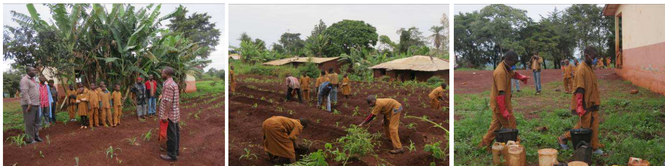
De gauche à droite : accompagnement par les services techniques de la Mairie dans l'utilisation des urines comme fertilisant naturel dans les champs écoles du projet MODEAB.

Toutes les écoles bénéficiaires de Modeab (à l'exception de l'EP Gr4 de Bangangté située en ville) disposent d'une parcelle. En fonction des résultats de l'étude expérimentale de l'année dernière, la mairie de Bangangté a accompagné les enseignants, élèves et parents des 9 écoles à fertiliser l'urine sur la base du dosage ayant donné le meilleur résultat. L'accompagnement concernait la bonne utilisation des urines et surtout les bonnes pratiques de manipulation de celles-ci. Le calendrier a été le suivant : le semis du maïs et des haricots a eu lieu fin avril, la 1 ère fertilisation, 3 semaines plus tard en mai, puis une 2 ème début Juin et la récolte mi août. Les habitants ont pu observer une nette amélioration des rendements sur les parcelles fertilisées, malgré l'interruption de la pluie après les semis.