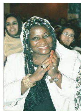
Mme le Maire à Laayoune,

A Bahreïn, du 25 au 29 Juin dernier à l'invitation du programme United Nations Public Administration Network (UNPAN), pour la récompense du prix du service public (United Nation Public Service Award) au réseau Refela pour lequel Mme le maire est vice-présidente.