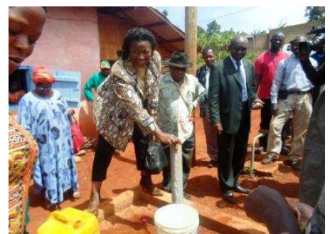
Madame le Maire lors de la réception provisoire à Bangoulap

Une nouvelle étape commence pour le village de Baména : l'entreprise Africa Koms a quitté définitivement ce chantier lors de la réception définitive du 3 mai 2013. Ainsi, à partir de maintenant, l'exploitant et le CUE ont la responsabilité totale du réseau avec bien sûr l'appui de la Régie communale de l'eau. Tous les acteurs se sont mis au travail et malgré les difficultés causées par des nombreuses fuites et coupures d'électricité, le service est continu et régulier. Concernant les termes du contrat de délégation, la période d'essai de trois mois établie pour évaluer l'évolution des paramètres de négociation, ne sera finalement pas suffisante et une