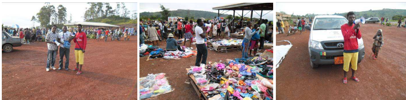
De gauche à droite : Animateurs au marché de Kafeng.

La campagne commencée à la fin du mois de juin finit début septembre et comprend entre autres des outils tels que distribution de t-shirts, sacs, savons et la création des spots radio servant à mieux diffuser le message. Gageons que cela porte ses fruits !