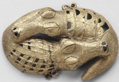
• Baoulé, Côte d'Ivoire