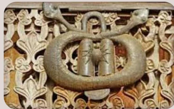
• Bamoun, Cameroun