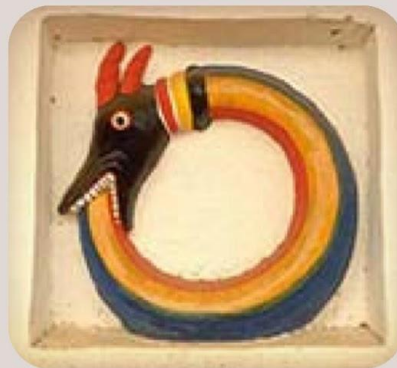
• Fon, Bénin