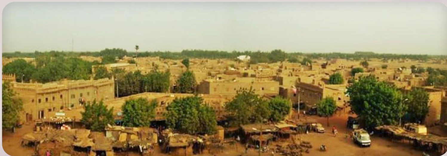
• La ville de Djenné (Mali)