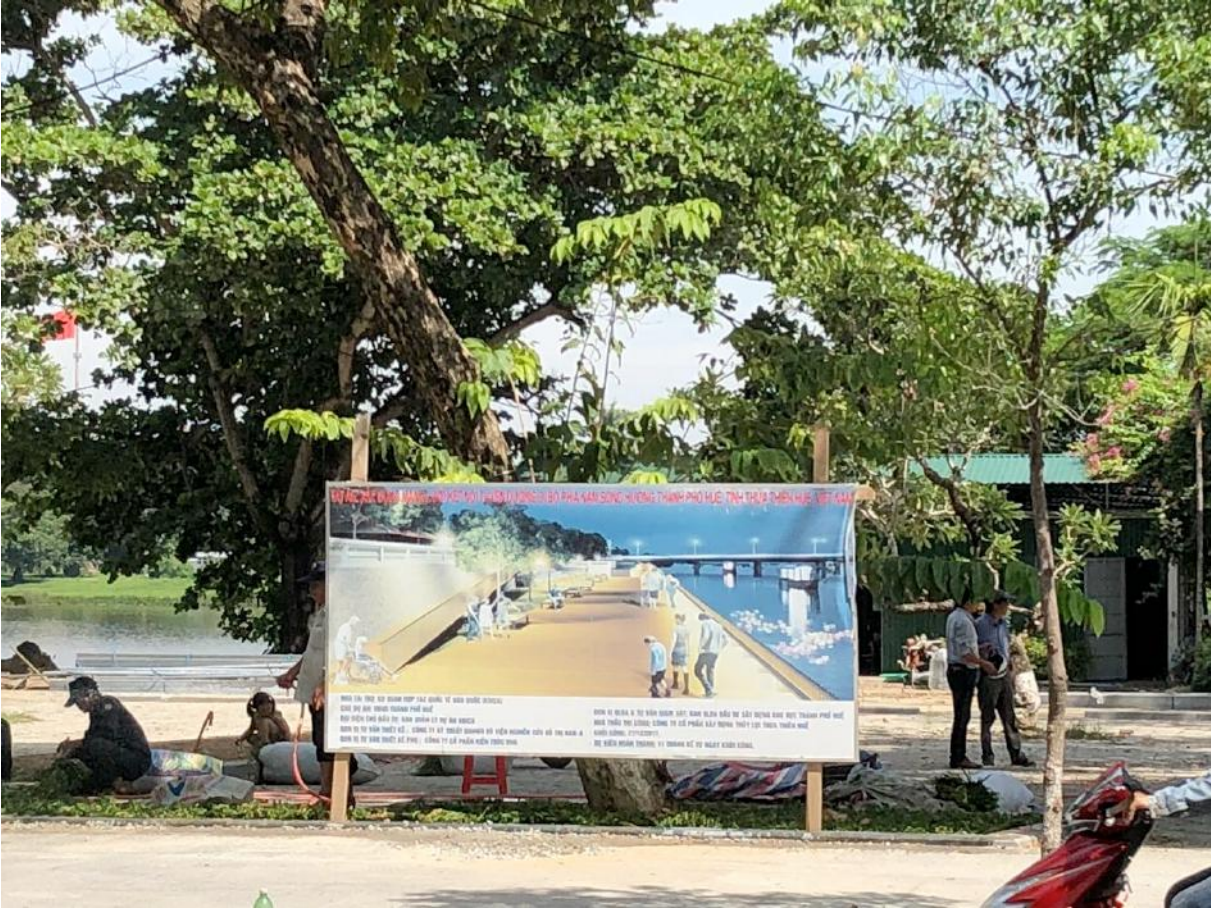
Projet des berges © Ghézeline MOUMENI