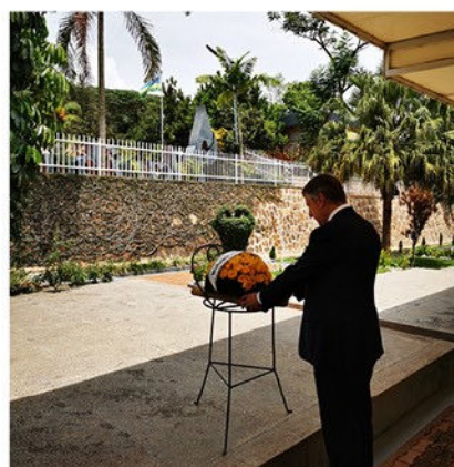
Au mémorial du génocide de Kigali