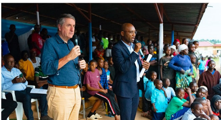
Allocution du bourgmestre lors des festivités du jumelage