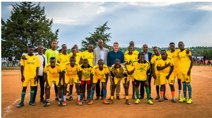
A l'occasion des festivités du jumelage, match amical entre Mbazi et Simbi

Ce voyage a également permis aux autorités woluwéennes de rendre hommage aux victimes du génocide qui a durement frappé le Rwanda en 1994. A cette fin, tous deux ont déposé une gerbe de fleurs au mémorial du génocide de Kigali et au mémorial de Camp Kigali, lieu de souvenir pour les dix para-commandos belges décédés lors du génocide. Ils ont, en outre, déposé des fleurs au mémorial du génocide de Mbazi en présence des jeunes de la commune. |