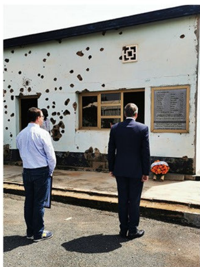
Moment de recueillement au mémorial de "Camp Kigali"