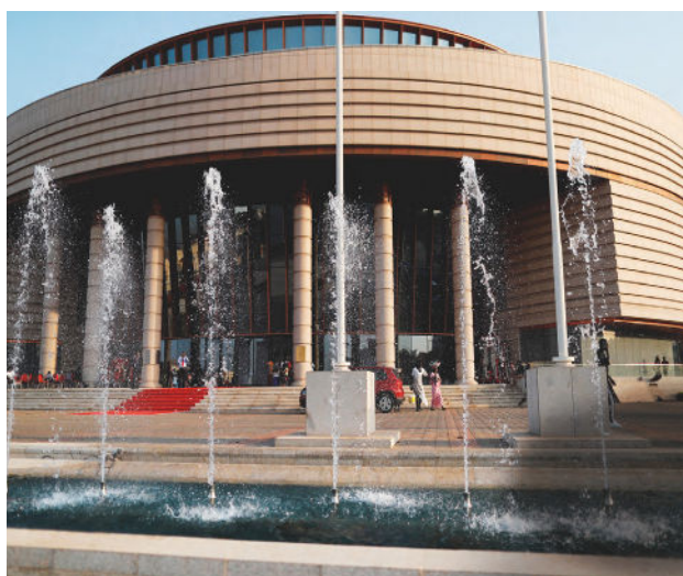
Musée des Civilisations Noires

Une déclaration politique finale et une feuille de route du Forum Mondial de l'ESS GSEF DAKAR 2023 seront adoptées et présentées lors de la clôture.