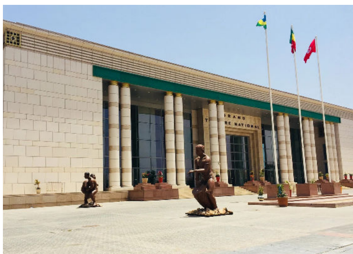
Grand Théâtre National