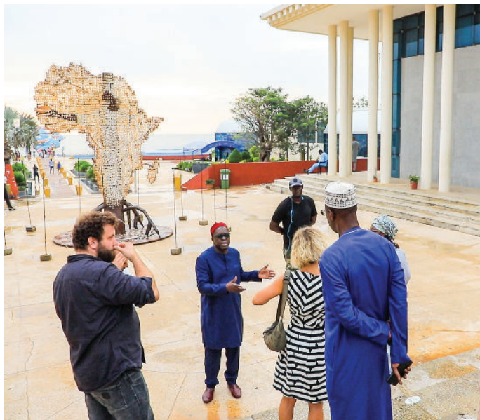
Place du Souvenir