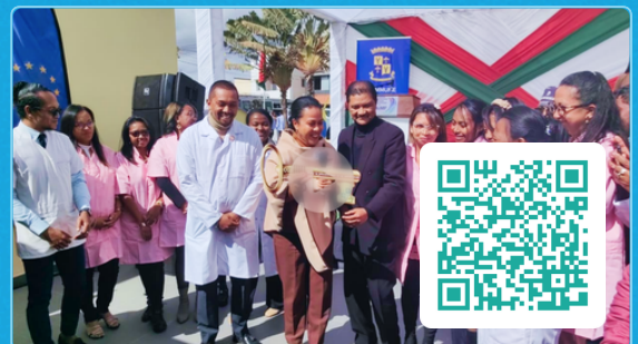
ANTANANARIVO - Centre de santé intégré contre les violences basées sur le genre